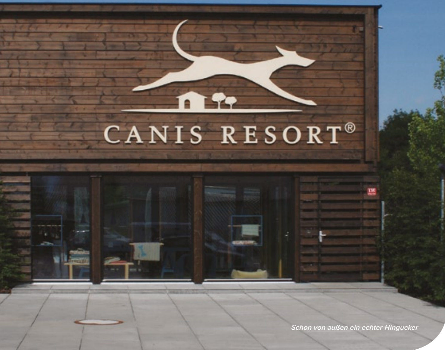
Schon von außen ein echter Hingucker

Intensive Betreuung, liebevolle Pflege und ein besonderes Erlebnis für Ihren Hund – das bietet Canis Resort, die erste Luxus-Hundehotel-Kette der Welt. Das Hotel für vier Pfoten ist im Dezember 2008 in Freising bei München, also in unmittelbarer Nähe des Münchner Flughafens, an den Start gegangen.